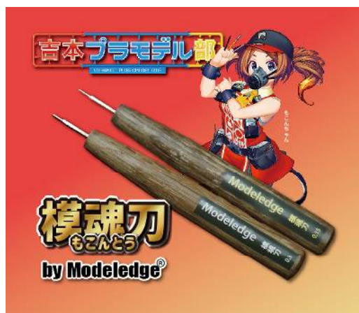
パッケージにも吉本プラモデル部もこんちゃんを起用！

刃物職人が一本一本魂を込めて作った模魂刀で楽しいスジボリライフをお過ごし下さい！