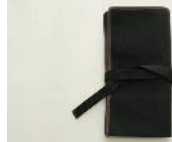
長めの平紐付きで縛れます。