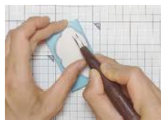
使い方として、一度普通の消しゴムはんこの作り方で作り、丸刃でさらった余白を整える感じで使用すると効果的です。