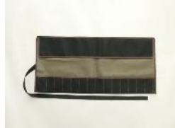
黒ボディ×茶テープ。裏地はオリーブグリーンを採用。

彫刻刀を収納するケースにこだわりを求め方も多いはず。ということで2022年、素材から縫製までこだわり作った彫刻刀キャンバスケースを発売いたしました。従来の物よりも厚手な素材を採用し、裏地付きでしっかりしたものとなっております。フラップ付きで落下しにくく安全です。良い刃物には是非良いケースをお使いください。