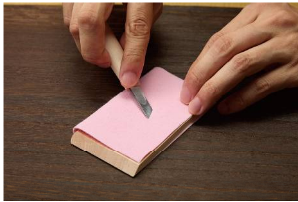
このように刃を置き、刃先をクロスに引いてこするだけでOK！

彫刻を楽しむ方なら誰しもがぶち当たる壁、刃物の研ぎ問題。以前から、砥石よりも簡単に気軽に安く省スペースで研ぎが出来るものはないか、というご要望をたくさんいただいております。砥石にせよ研ぎ機にせよ、初心者の方にはどうしてもハードルが高く、手を出せないでいるという方も多くいらっしゃること