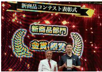
2024年8月に行われたDIYショー授賞式の様子

2024年8月に幕張メッセで開催された日本DIYホームセンターショーの新商品にEZケアーにてノミネット。九十社の新商品の中からなんと上から五番目