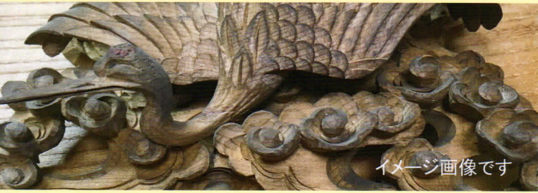
イメージ画像です

先出しが長く丈夫な刃先が特徴！ スケールの大きな彫刻で役に 立ちます。 欄間の入り組んだ部分や衣 の間など彫刻刀では届か ないところにも便利です。